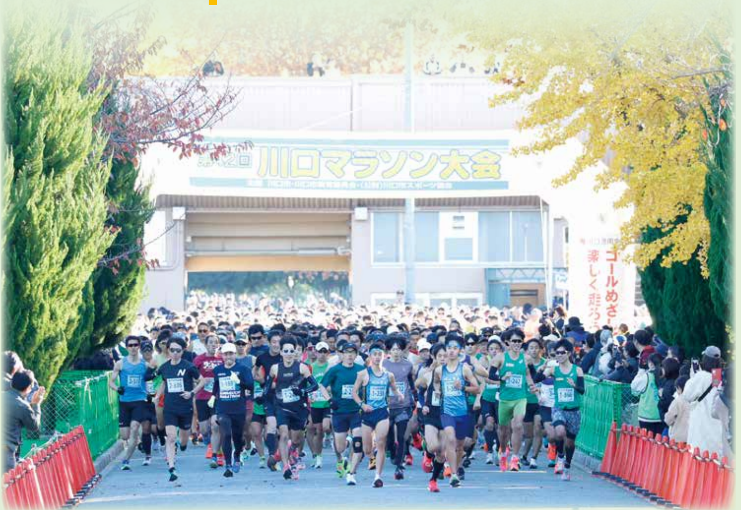
第 42 回川口マラソン大会の様子